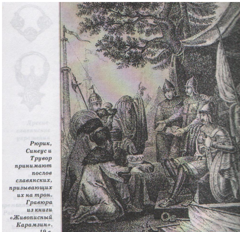
Рюрик, Синеус и Трувор принимают послов славянских, призывающих их на трон. Гравюра из книги «Живописный Карамзин». 19 в.